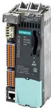
CPU pour le contrôle de la servo-presse