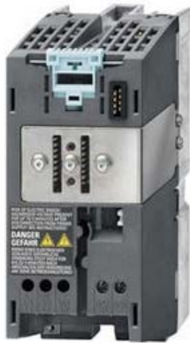
Drive, partie puissance