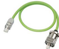
Câble pour alimentation moteur